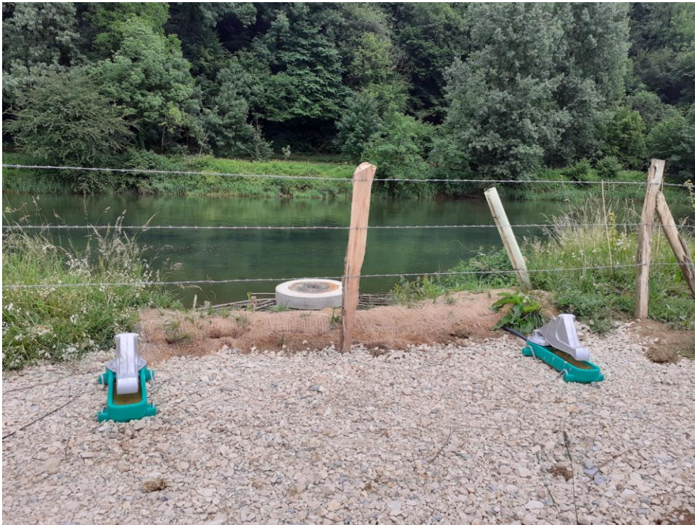
Le puit et les pompes à museaux

Avez-vous remarqué les nouvelles clôtures ainsi que les pompes à museaux ?