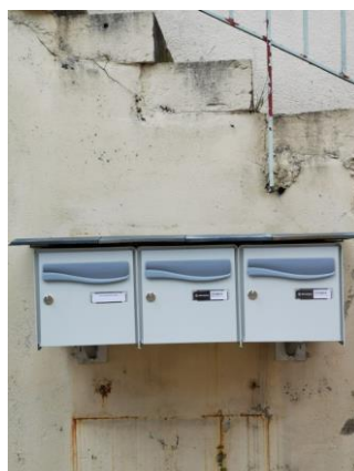
De nouvelles boites aux lettres ont été installées pour les logements de la mairie.