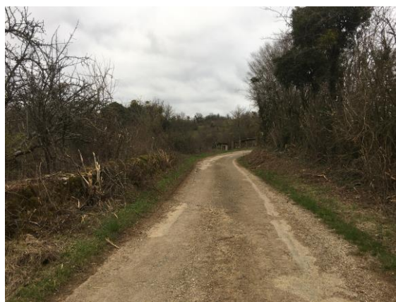
Chemin de Chantlibas

Les travaux d'élagage des chemins ont été réalisés également :