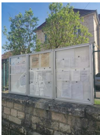
Les nouveaux panneaux d’affichage devant la mairie.