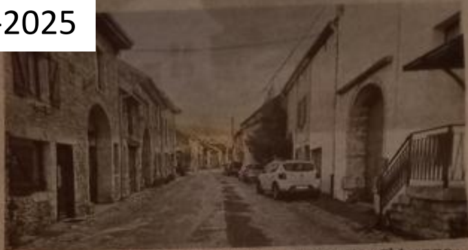
L'une des rues où le cortège déambulait lors de la « Ch'vanne ».

Le carnaval de Besançon avec son défilé et ses chars aura lieu ce dimanche 13 avril. L'occasion de rappeler aux anciens et aux nouveaux habitants du village une tradition absente dans les alentours et qui eut lieu vraisemblablement pour la dernière fois dans les années 1950 : la « Chevanne », dite « Ch'vanne ».