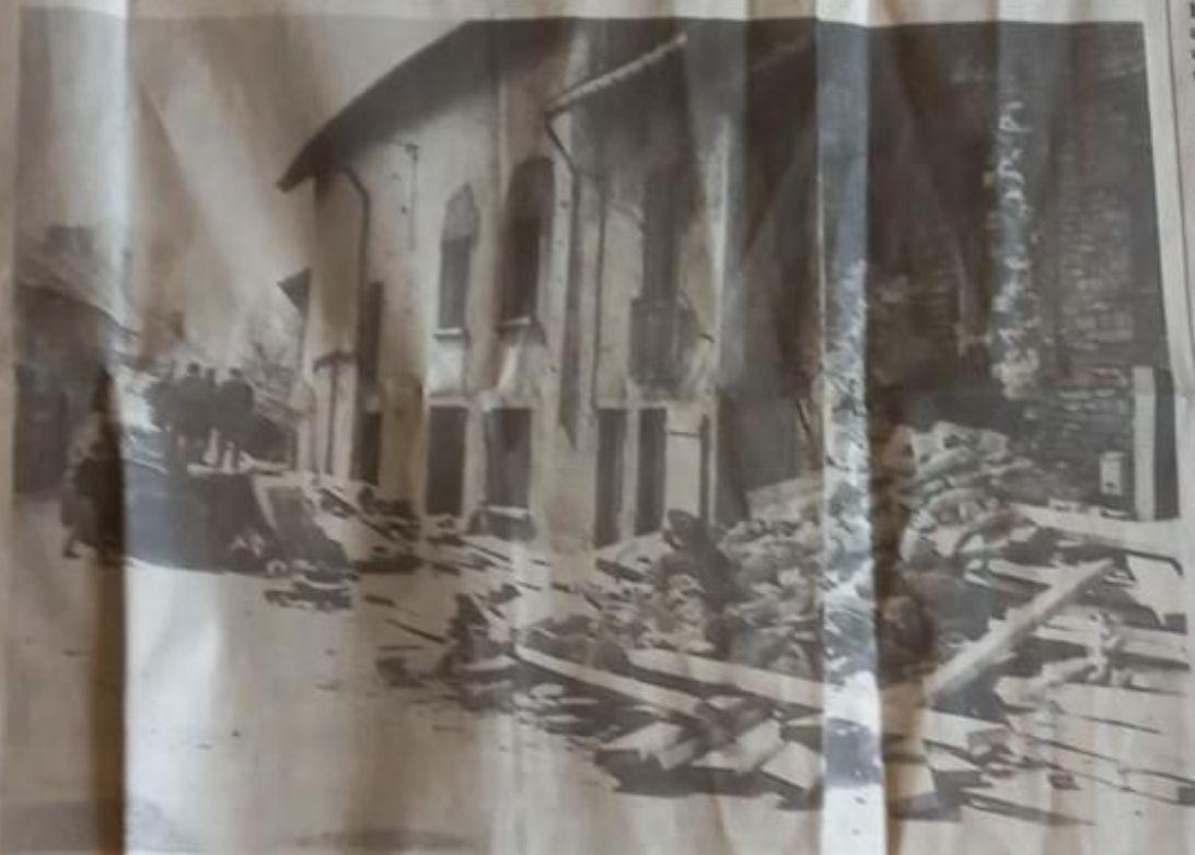
« J'ai cru à un bombardement », a confié l'unique habitant de la maison visée.

« J'ai cru à un bombardement », balbutia-t-il peu après, sous le choc d'une forte émotion. « C'est un miracle que je m'en sote sans une aggrava- tion ».